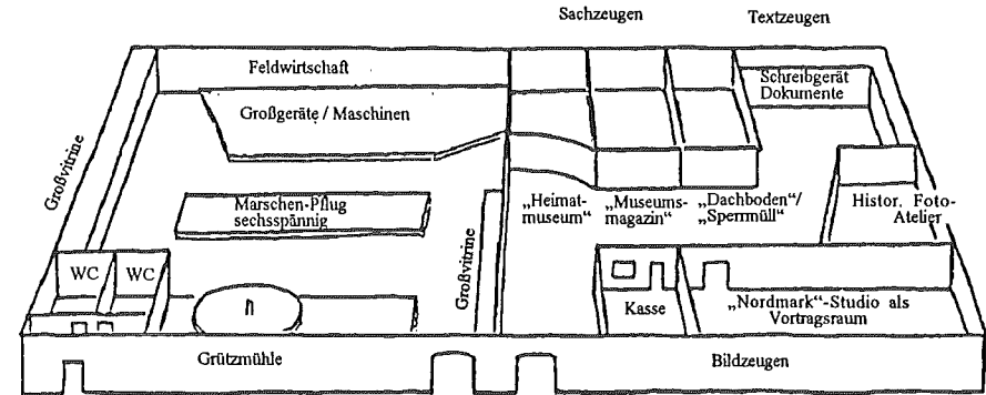
Haus 12 („Körnerhaus“): Erdgeschoß

wirtschaft und Handwerk das Herzstück der Gortorfer Volkskunde-Sammlungen ausgebreitet. Eine steinerne Treppe und eiserne Flügeltüren aus der Erbauungszeit führen in weiträumige niedrige Hallen - die es nun mit lebendiger Ausstellungsarchitektur zu füllen gilt. Die bisherigen Planungsskizzen sehen folgende Einteilung vor: